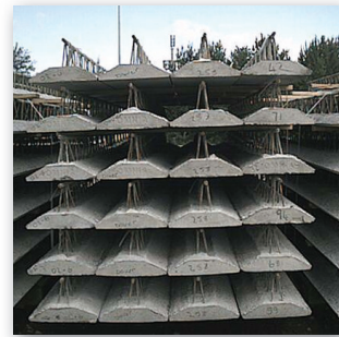
Los moldes de hormigón están preparados para su colocación