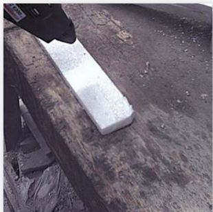
Aplicación del adhesivo en spray sobre una pieza de espuma