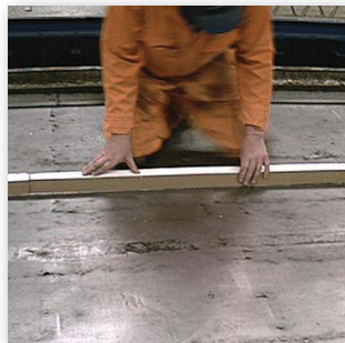
Colocación del elemento en la posición que precise.